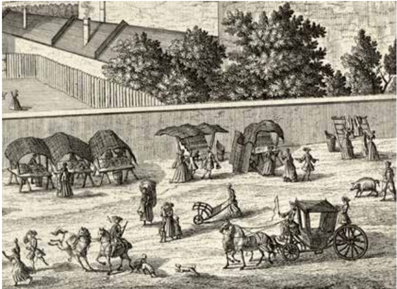
Abb. 4. Hunde und Pferde als oft problematische Tiergemeinschaft in der Stadt auf Wiener Veduten. Salomon Kleiner [Zeichner], Johann August Corvinus [Kupferstecher], Johann Andreas d. Ä. Pfeffel [Verleger], „Die Kirche bey Mariae Hülff auf der Leimgruben“ (Maria-Hilf-Kirche, Mariahilferstraße), Ausschnitt aus dem Kupferstich, 1724, aus Wahrhafte und genaue Abbildung [...] I. , Abb. 25. Wien Museum, Inv.-Nr. 105765/27, in: Wien Museum, Online Sammlung , [online], [zit. 24. November 2022], < https://sammlung.wienmuseum.at/objekt/181017/ >.