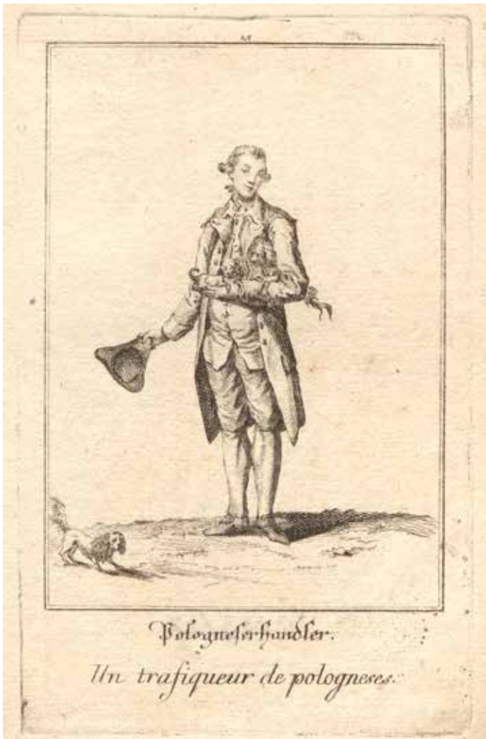
Abb. 6. Jakob Adam, „Abbildungen des gemeinen Volks zu Wien“, Blatt 27: „Pologneserhändler. Un trafiqueur de pologneses“ [Verkäufer von Bologneser-Hunden], Kupferstich, 1777. Wien Museum, Inv.-Nr. 20553/27, in: Wien Museum, Online Sammlung , [online], [zit. 24. November 2022], < https://sammlung.wienmuseum.at/objekt/50538/ >.