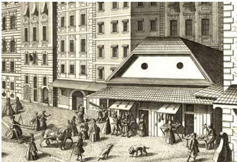
Abb. 5. Hungrige Hunde vor der Wurstbude am Tiefen Graben im Bild Wiener Veduten. Salomon Kleiner [Zeichner], Johann Georg Ringlin [Kupferstecher], Johann Andreas d. Ä. Pfeffel [Verleger], „Prospect im tieffen Graben“ (Tiefer Graben), Ausschnitt aus dem Kupferstich, 1737, aus Wahrhafte und genaue Abbildung [...] IV. , Abb. 6. Wien Museum, Inv.-Nr. 105765/112, in: Wien Museum, Online Sammlung , [online], [zit. 24. November 2022], < https://sammlung.wienmuseum.at/objekt/181487/ >.