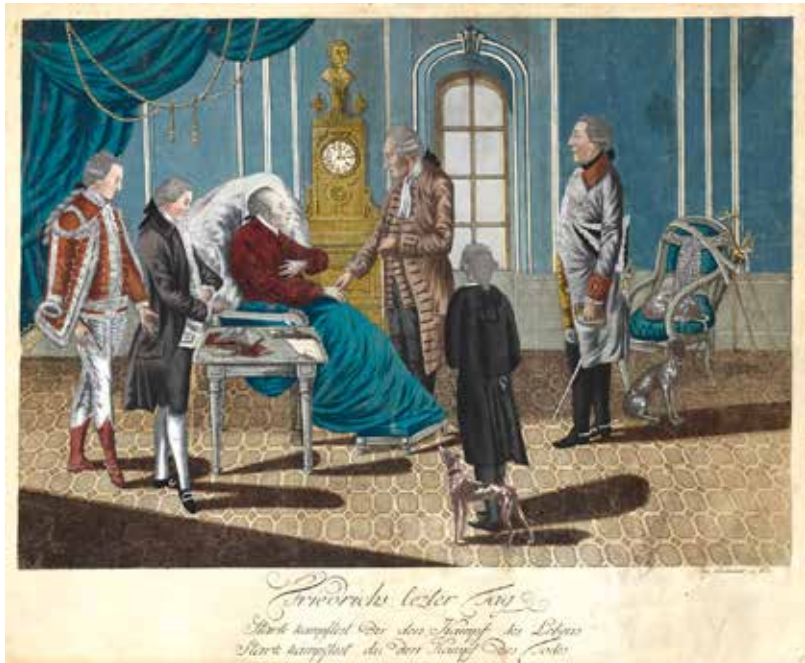
Abb. 2. Tiere als sterbebegleitende Lebewesen. Johann Hieronymus Löschenkohl, „Friedrichs letzter Tag“ (Friedrich der Große am 17. August 1786), Kupferstich, 1786. Wien Museum, Inv.-Nr. 108585, in: Wien Museum, Online Sammlung , [online], [zit. 24. November 2022], < https://sammlung.wien-museum.at/objekt/186239/ >.