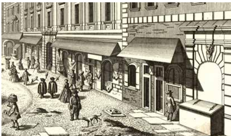
Abb. 3. Pissender Hund und urinierender Mann auf Wiener Veduten. Salomon Kleiner [Zeichner], Johann Bernhard Hattinger [Kupferstecher], Johann Andreas d. Ä. Pfeffel [Verleger], „Prospect auf der Brandstatt“ (Brandstätte/Jasomirgottgasse), Ausschnitt aus dem Kupferstich, 1737, aus Wahrhafte und genaue Abbildung [...] IV , Abb. 5. Wien Museum, Inv.-Nr. 105765/111, in: Wien Museum, Online Sammlung , [online], [zit. 24. November 2022], < https://sammlung.wienmuseum.at/objekt/181486/ >.