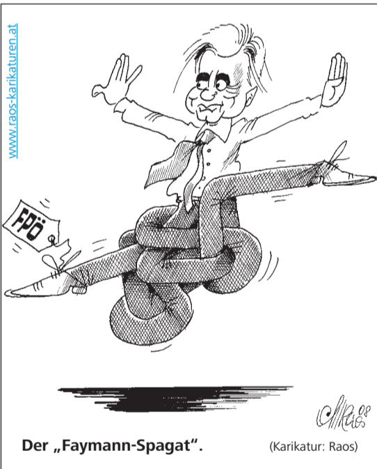
Der „Faymann-Spagat“.