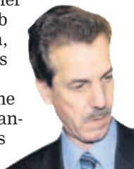
Franz Fiedler

Unterdessen geht die Suche nach eventuellen orangenen Kandidaten weiter. Zumindest als Gerücht existiert die Kandidatur des ehemaligen Rechnungshof-Präsidenten Franz Fiedler.