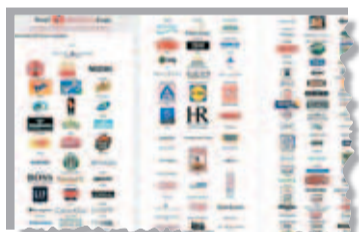
Antisemitisches Flugblatt, das suspendierter Islam-Lehrer in Wien verteilt hat.