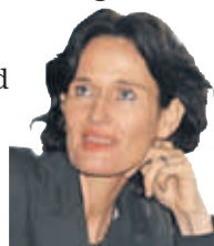
Eva Glawischnig