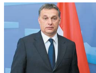
Rückschlag für Orbán – Ungarn drohen Sanktionen.

MOSKAU. Die russische Wahlleitung hat dem liberalen Oppositionspolitiker Grigori Javlinski als Gegner von Regierungschef Putin die Zulassung zur Präsidentenwahl verweigert. Als Begründung wird angegeben, dass 24 Prozent der nötigen zwei Millionen Unterstützungsunterschriften für ihn ungültig seien. Aus Sicht von Beobachtern soll Javlinskis Ausschluss helfen, dass Putin in der ersten Runde gewinnt, ohne in eine Stichwahl zu müssen.