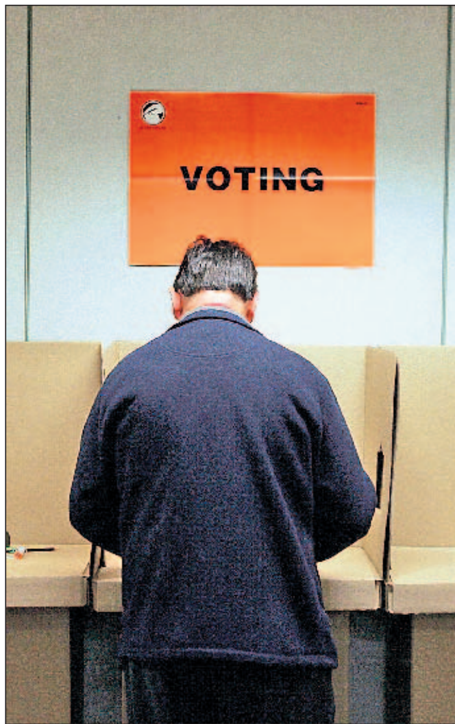
Ein Beispiel von vielen: In Neuseeland sind Ausländer schon nach einjährigem Aufenthalt wahlberechtigt.

In aller Regel ist es zumeist die Staatsangehörigkeit, über die versucht wird, die Frage der Betroffenheit zu beantworten und die Teilhabe an politischen Entscheidungsfindungsprozessen zu regeln. Doch während es zu Beginn des 20. Jahrhunderts durchaus Sinn