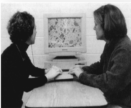
Abbildung 1, Versuchsaufbau von Wegner & Wheatley (1999)

Wegner führte in einem Versuchsaufbau diesen Gedanken weiter („I spy study“, 1999) Seiner Argumentation zufolge muss es logisch unmöglich sein, einen introspektiven Zugang zu den kausalen Verbindungen zwischen den beeinflussenden Kräften und den Verhaltenskonsequenzen zu haben. In dem von ihm durchgeführten Versuch zeigt er, dass unsere Erfahrung des „Willens“ manipuliert werden kann.